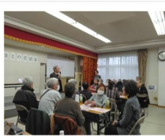
見守りネット己斐東 (己斐東小学校区)