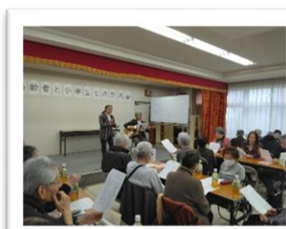
こいこい見守りネット (己斐小学校区)

概ね75歳以上の方が安心して生活が送れるよう、声かけや見守りをおこなう仕組みです。お問い合わせ・登録希望の方は包括支援センター又は、町内会、民生委員までご相談ください。